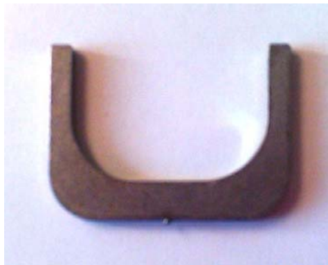
Reparatur – Kit Federbein

Nach erfolgter Reparatur ist das Federbein den Technischen Kommissaren vorzulegen.